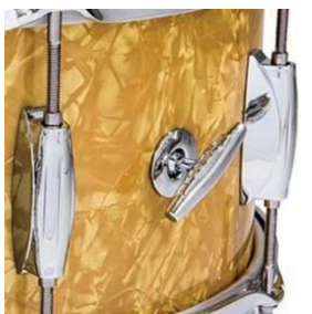
Snap-In Key Holder