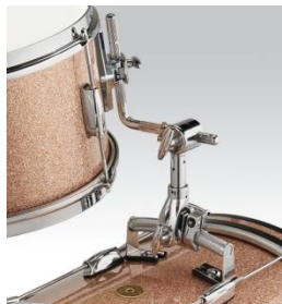
2020 Rail Mount System