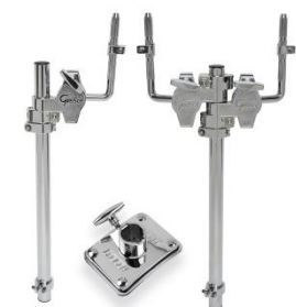
Einzel- od. Doppeltomhalter mit G4946 Rosette