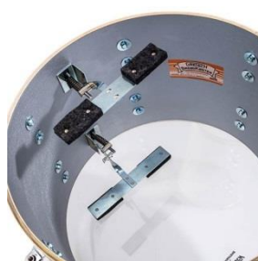
Dämpfer Schlag- und/oder Resonanzseite