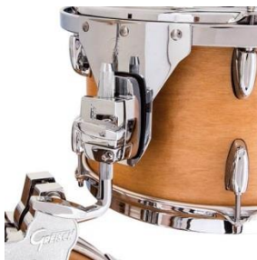
Standard GTS Tomhalterung