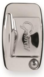
9025 Hinged Bracket 12,7 mm für Rack Toms und Floor Toms