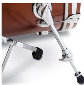
Standard G9013 spurs