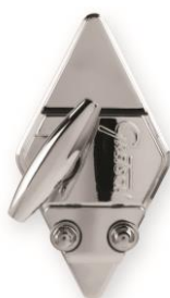
4825 Hinged Bracket 12,7 mm für Rack Toms und Floor Toms