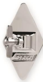
4820V Vintage Bracket 9,5 mm für Rack Toms und Floor Toms