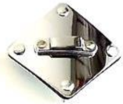
Spade Plate für Rack Tom (nur in Kombination mit Vintage Rail Mount System)