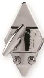
4825 Hinged Bracket 12,7 mm für Rack Toms und Floor Toms