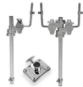
Einzel- od. Doppeltomhalter mit G4946 Rosette