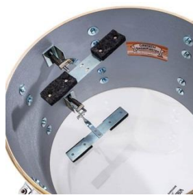
Dämpfer Schlag- und/oder Resonanzseite