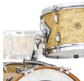
Vintage Rail Mount System