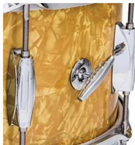
Snap-In Key Holder