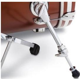
Standard G9013 spurs