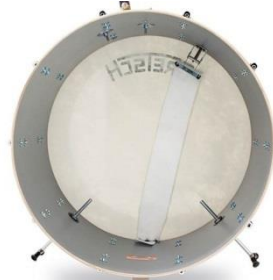
Bass Drum Dämpfer Schlag- &/od. Resonanzseite