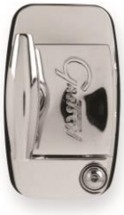
9025 Hinged Bracket 12,7 mm für Rack Toms und Floor Toms