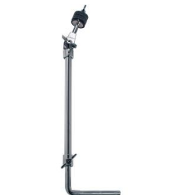
Bass Drum Cymbal Arm