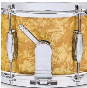
Micro Sensitive Snare Abhebung