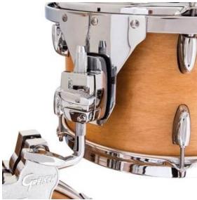
Standard GTS Tomhalterung