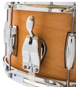
Lightning Snare Abhebung