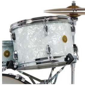
Keine Tomhalterung (für Snare Ständer)