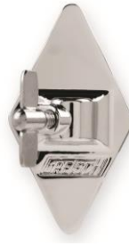
4820V Vintage Bracket 9,5 mm für Rack Toms und Floor Toms